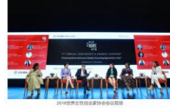
2018世界女性创业家协会会议合影

会议期间，与会嘉宾围绕“女性领导力”、“女性领导力”、“女性领导力”等主题进行了深入的交流和探讨。会议还举办了多场专题研讨会和圆桌论坛，为与会嘉宾提供了宝贵的经验和启示。会议在热烈的掌声中圆满结束。